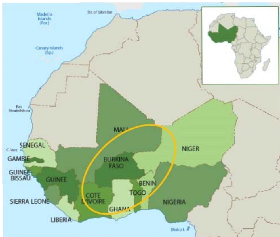
Figure 2: Carte de l'Afrique de l'Ouest (Adapté de http://www.afdb.org/fr/countries/west-africa/ ).

L'un des objectifs du réseau a été de faire du CIRDES un centre régional spécialisé non seulement dans le diagnostic moléculaire de la trypanosomose animale africaine, mais aussi dans celui de la résistance aux trypanocides couramment utilisés en Afrique de l'Ouest i.e. l'acéturate de diminazène et le chlorure d'isométymidium. Des techniciens du CIRDES ont été formés et ont acquis la maîtrise des tests PCR-RFLP mis au point par l'IMT pour le diagnostic moléculaire d'espèce et de la résistance de Trypanosoma congolense (Tc) à l'acéturate de diminazène (5, 6, 15, 24).