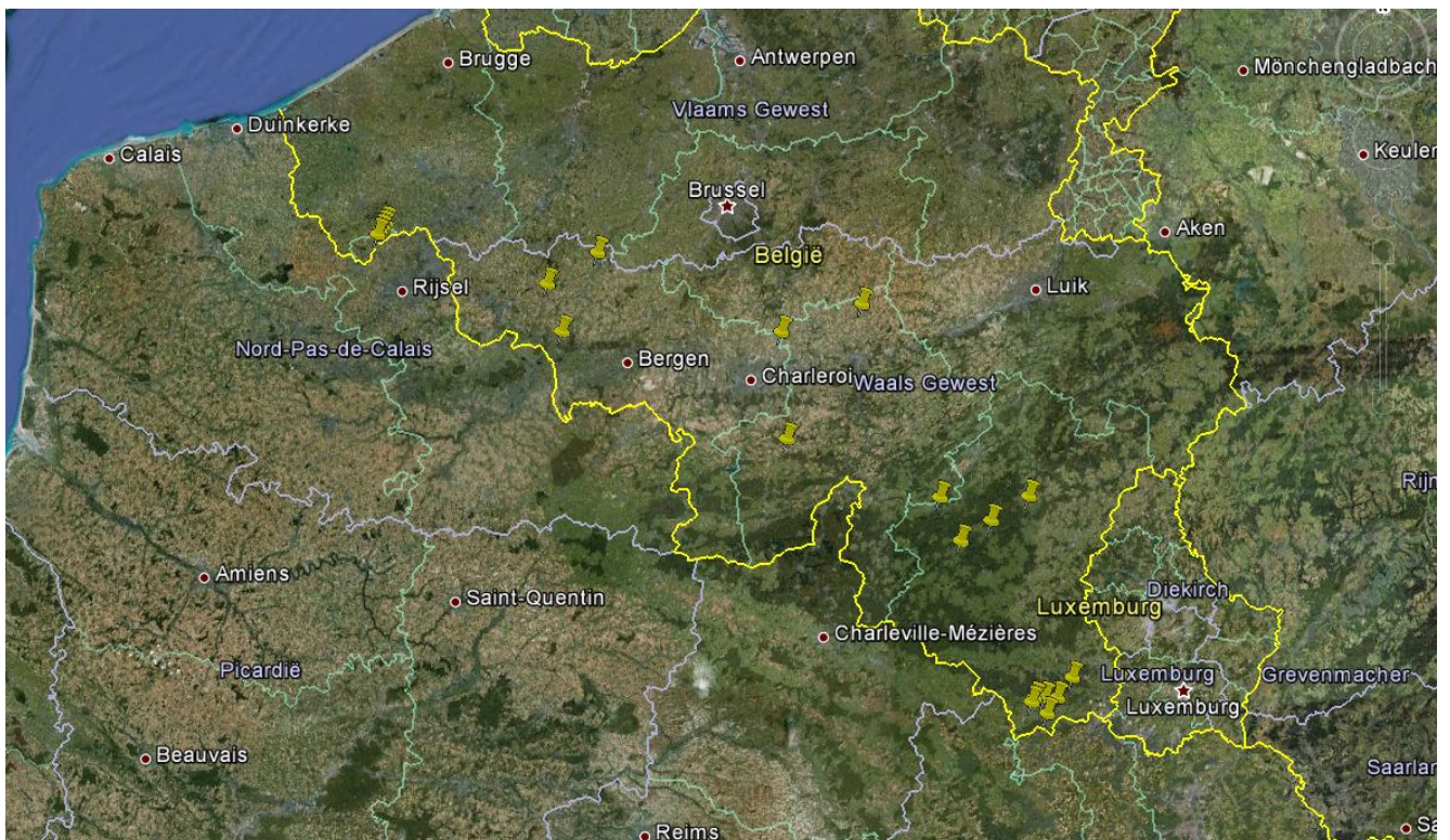
Kaart 2: Plaats van afschot of vindplaats van de verkeersslachtoffers van de 18 onderzochte vossen en 2 onderzochte dassen in de met Trichinella besmette pool.

Bijkomend werden de resterende vleesresten van alle dieren die behoorden tot de met Trichinella besmette pool, individueel onderzocht. Dit bijkomend onderzoek leverde echter geen bijkomende Trichinella -larven op. Het is dus niet mogelijk om het dier te identificeren dat besmet was met de gevonden Trichinella -larve. Kaart 2 geeft de herkomst van de onderzochte dieren weer (zijnde 18 vossen en 2 dassen) uit de met Trichinella besmette pool.