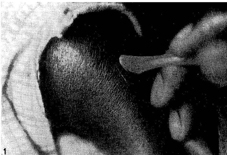
Figure 1 Incisions dermiques